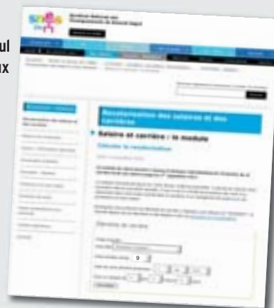
Le module de calcul des gains salariaux

Partout, de nombreuses réunions sont organisées (stages de formation syndicale, heures mensuelles d'information...).