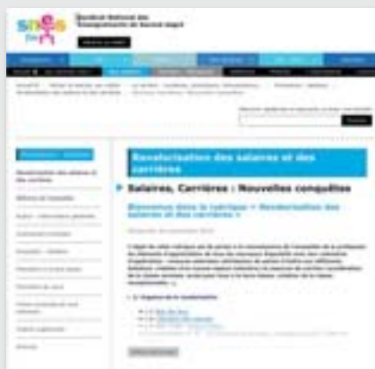
La rubrique « Revalorisation des salaires et des carrières »